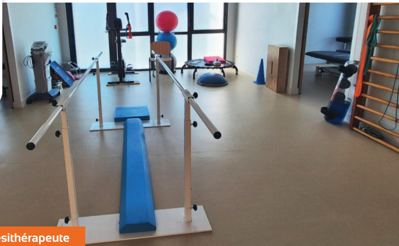
Plateau technique kinésithérapeute

Maison de santé pluridisciplinaire MARSAC-LE GRAND BOURG